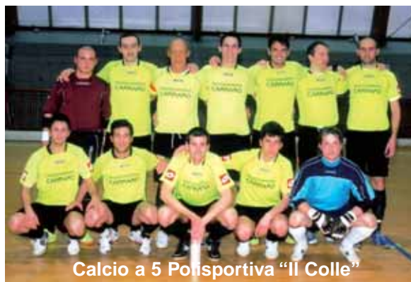
Calcio a 5 Polisportiva "Il Colle"

S. Giustina in Colle - Fratte , campo sportivo. Finale torneo calcio per tutti i giovani a partire dai 18 anni. A cura del Calcio Fratte. Tel. 3358012108.