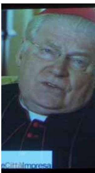
Il Patriarca Scola "E' in crisi il soggetto personale e comunitario"